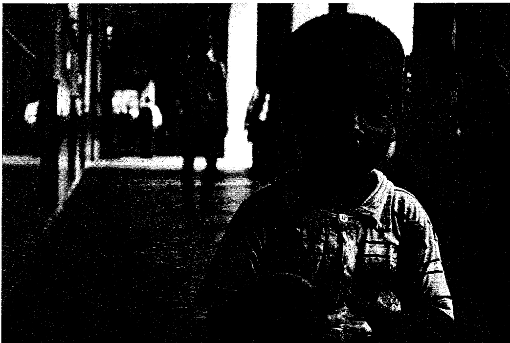
En lille dreng, som fik en kiks, og efter overraskelsen løb grinende væk.